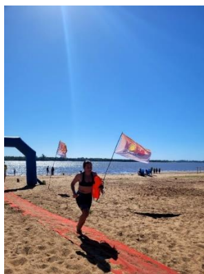
Mi mayor zona de disconfort

La zona de disconfort es un estado donde nos sentimos incómodos, ansiosos o estresados debido a situaciones nuevas o desafiantes. Practicar la incomodidad voluntaria nos ayuda a adaptarnos y crecer, estableciendo la incomodidad como un hábito.